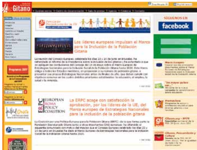
LA WEB GITANOS.ORG EN 2011, ANTES DE LA REMODELACIÓN QUE VERÁ LA LUZ EN 2012

Las redes sociales han mostrado su impresionante avance en 2011 (basta señalar que Facebook alcanza los 800 millones de usuarios mundiales) y la comunidad gitana no ha sido ajena a este importante fenómeno. La página de la FSG en Facebook ha tenido durante este año una muy frecuente actualización de contenidos y un progresivo incremento de seguidores. Entre los más fieles o "fans" se alcanzó a finales de año la cifra de 1.800. En 2012 daremos el salto a Twitter.