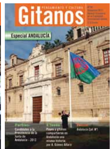
PORTADAS DE LOS CUATRO NÚMEROS DE LA REVISTA GITANOS EN 2011