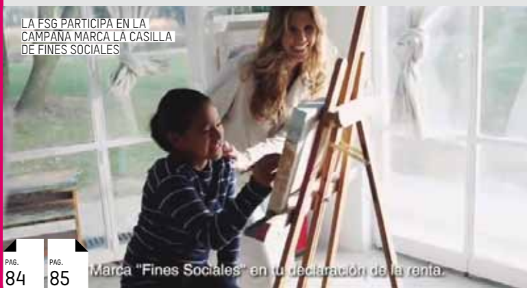
LA FSG PARTICIPA EN LA CAMPANA MARCA LA CASILLA DE FINES SOCIALES

Marca “Fines Sociales” en tu declaración de la renta.