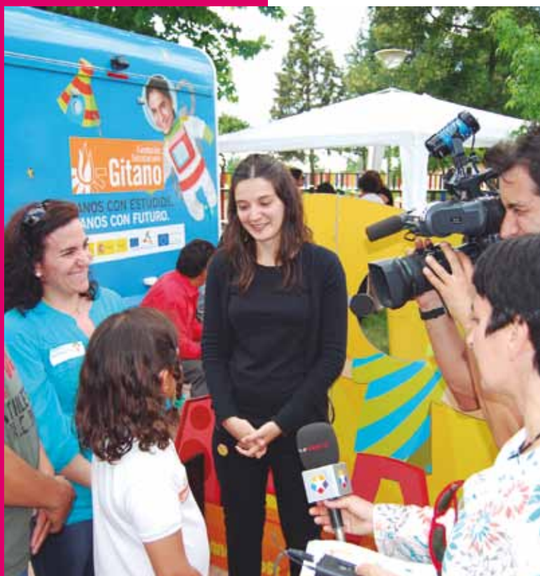
EL CUPÓN DE LA ONCE DEDICADO A LA EDUCACIÓN DE LOS NIÑOS GITANOS

También en la labor que se viene realizando con los medios de comunicación desde el Gabinete de prensa de la entidad, la educación ha sido un año más un tema fundamental que ha tenido su reflejo en numerosas noticias, reportajes y entrevistas en medios impresos y audiovisuales, tanto de ámbito estatal como local.